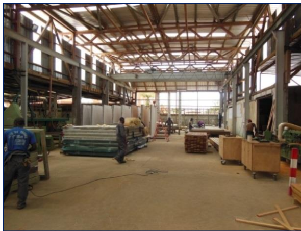
Halle de production avec pont roulant