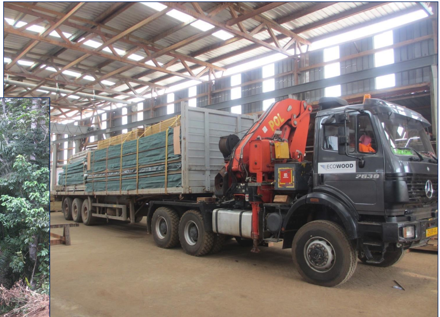
Transport des éléments ossature préfabriqués